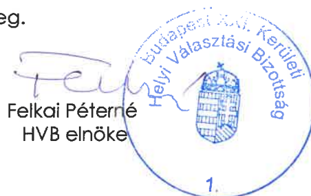
Felkai Péterné HVB elnöke