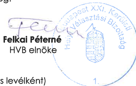
Felkai Péterné HVB elnöke