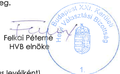
Felkai Péterne HVB elnöke